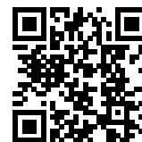
連絡メール2 保護者ログイン

* 保護者サイト https://renraku.education.ne.jp/parent/