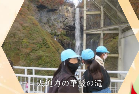
大迫力の華巖の滝