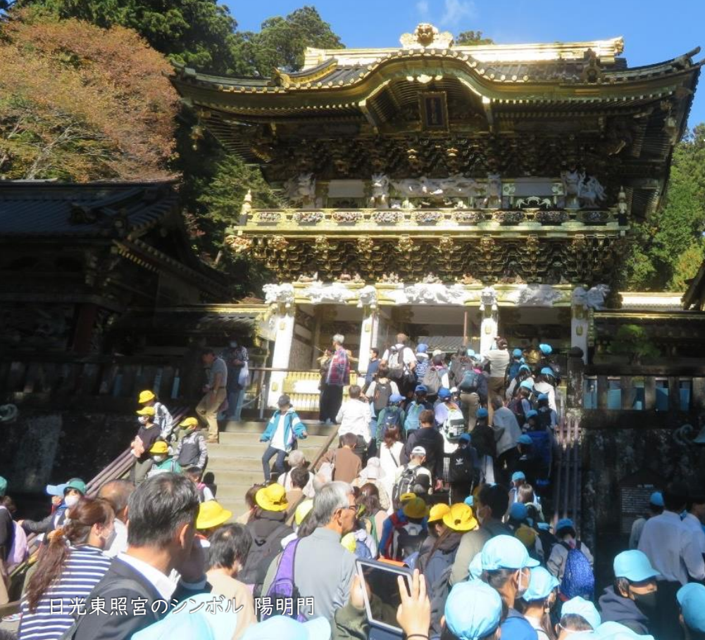
日光東照宮のシンボル 陽明門