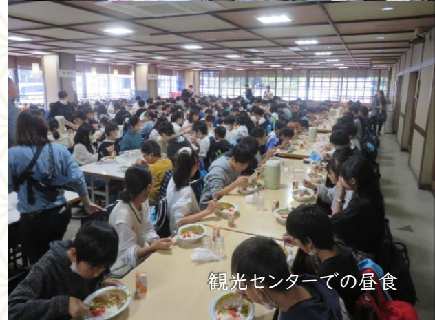
観光センターでの昼食