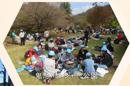
鬼怒川レジャー公園