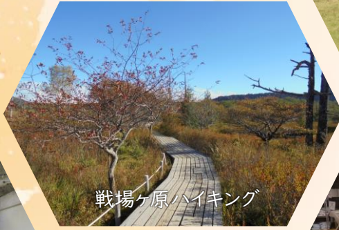
戦場ヶ原ハイキング