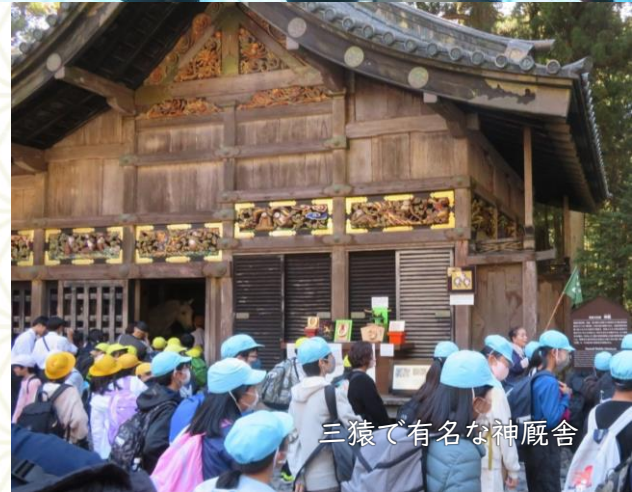
三猿で有名な神厩舎

渋滞にはまったり、雨に降られることもありましたが、6年生の子供達、そして引率の先生も二日間本当にお疲れ様でした。